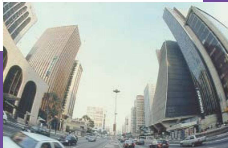
San Pablo, Brasil.

Hace ya muchos años que la Argentina es un país predominantemente urbano. Nueve de cada diez argentinos residen en áreas urbanas, aunque esa proporción varía en las distintas provincias. Casi la mitad de la población argentina reside en ciudades de más de 500.000 habitantes.