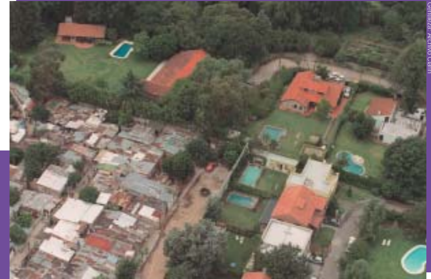
Geografía: Archivo Clarín

Algunas ciudades latinoamericanas conservan muy bien su patrimonio histórico. Los primeros barrios de la ciudad o los edificios más grandes y antiguos, como la casa de gobierno o las iglesias, forman parte de los llamados "centros históricos". Pero, además, en cada época, las ciudades crecen y cambian. Y las huellas de estos cambios quedan registradas en el paisaje urbano. La ciudad que vemos hoy es el resultado de una serie de decisiones de la sociedad a lo largo del tiempo.