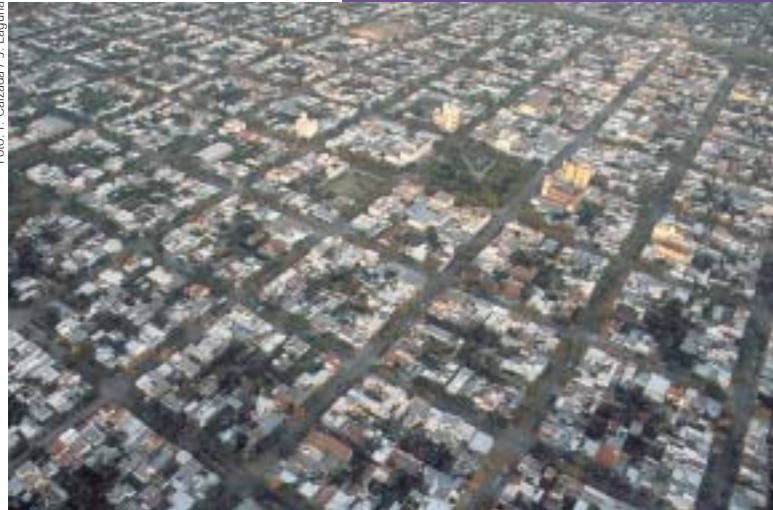
Pehuajó, provincia de Buenos Aires, Argentina.

El comercio y los servicios son las actividades económicas que caracterizan las ciudades. La industria, si bien es muy importante, no se encuentra presente en ellas. Las actividades económicas de la ciudad están dirigidas a quienes viven en ella, en las áreas rurales que la rodean y en otras ciudades. Estas actividades se encuentran muy enlazadas entre sí y en estrecha vinculación con las actividades agrícolas, ganaderas y mineras de su entorno.